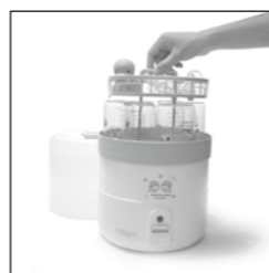
04. 將上、下層架子裝回並加蓋。