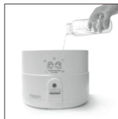
03. 將消毒鍋底座放50C. C. 清水。