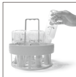
02. 下層可放最多7支奶瓶，開口朝下。