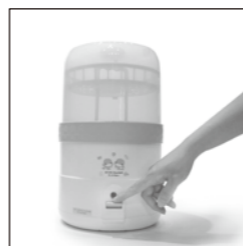
05. 插電後往下輕輕按指示燈會亮，消毒鍋已開始運作，當消毒完指示燈會自動關閉。